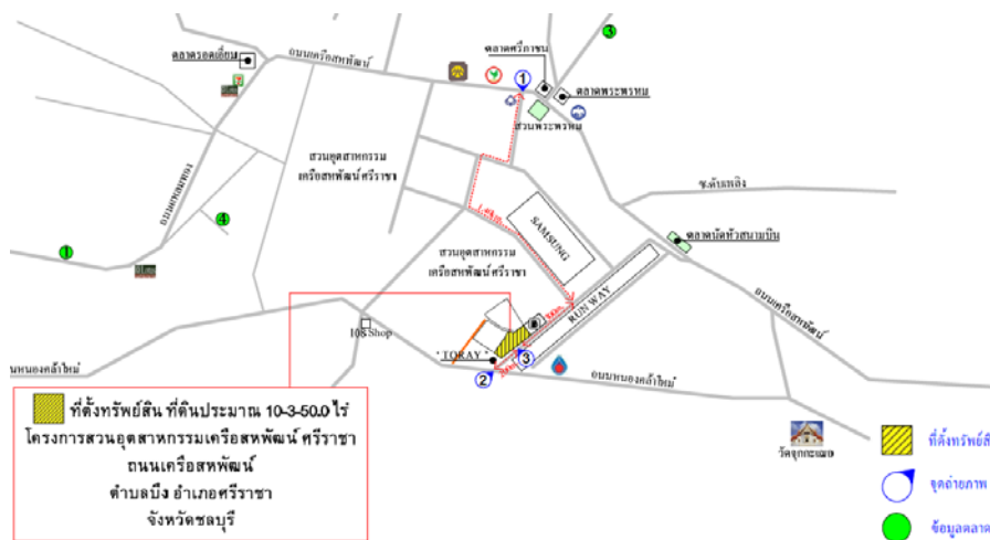
ภาพสถานที่ตั้งของที่ดินที่ TTM จะทำการซื้อจาก SPI