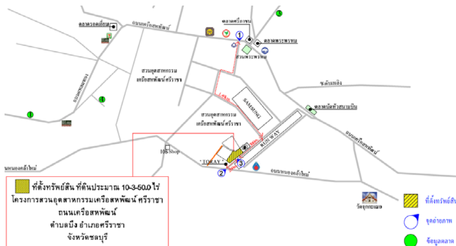
ภาพสถานที่ตั้งของที่ดินที่ TTM จะทำการซื้อจาก SPI